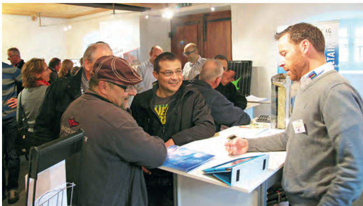
Fachausstellung Stansstad 2014