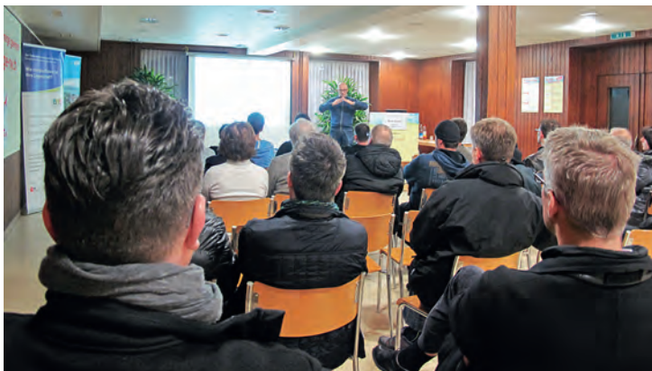
Fachvorträge Beckenried 2015