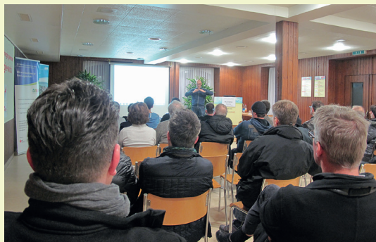
Fachvorträge Beckenried 2015

Weitere Informationen: www.energie-nw.ch