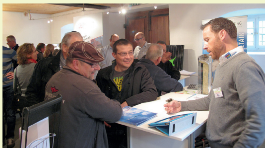
Fachausstellung Stansstad 2014

Die HAUS + ENERGIE NW zeigt mit marktführenden Ausstellern den aktuellen Stand, wohin sich energieeffizientes und nachhaltiges Bauen entwickelt. Sie bietet Hauseigentümern, Bauherren, Architekten, usw. einen einzigartigen Überblick und die grosse Chance, sich zu informieren und zu orientieren. An der HAUS + ENERGIE NW können sich Anbieter und Interessierte kompetent und unkompliziert austauschen. Ausserdem bietet sie wichtige Entscheidungshilfen für alle, die energiebewusst und effizient bauen wollen. Den Besucher erwartet eine klar nach Themen gegliederte und in einer überschaubaren Grösse auftretende Fachmesse sowie ein guter Branchenmix.