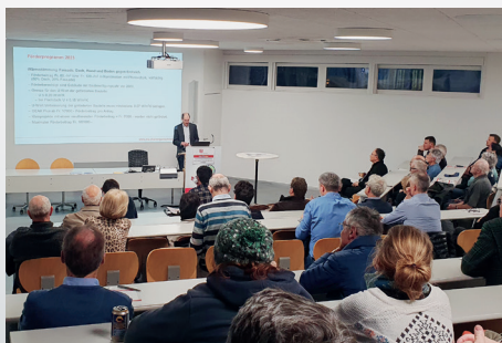
Fachvorträge 2023: Grosses Interesse