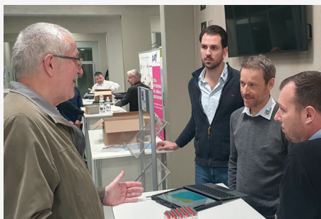
Beratungen aus erster Hand 2023